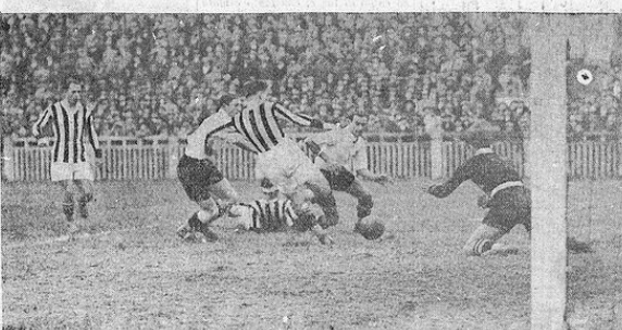
JUVENTUS batte PRO VERCELLI 4 a 1. - Ferrero, benché ostacolato da Piola, giunge in tempo a mettere in rete il pallone.