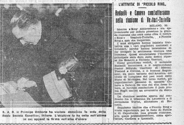
S. A. R. il Principe Umberto ha visitato domenica la sede della Reale Società Canottieri Italiana. L'obiettivo lo ha colto nell'attimo in cui egli firmava nell'albo d'onore

« Non scriverò mai di più di in- pressante sulla mia persona e sulla mia carriera che non è ancora finita, e che spero poter continuare con un certo celat ancora due o tre anni. E siccome mi sono allenato un po' troppo ogni su di me stesso e sulla mia famiglia, mi riservo, in un primo momento (che si manifesta fra un paio di settimane quando mi troverò tra i boschi nei pressi di Ginevra, in una partita con i « Palamari ») di oltre 100 combattimenti in grandissima maggioranza terminati con la mia vittoria e a vergine di k. o.) bastavano a fargli perdere il classico « bec de gaz » che mi sono stonare una lancia, come quella che sta dinanzi al Littoriale.